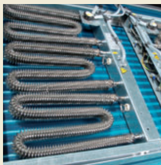
Option: Elektroheizung 1- oder 2-stufig