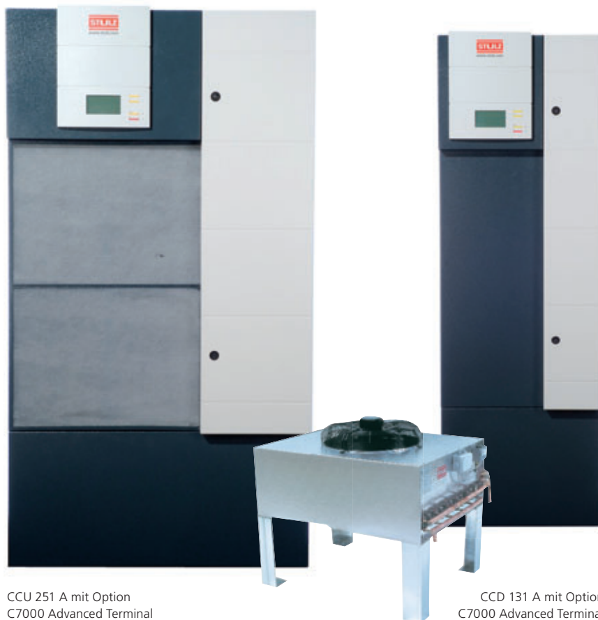
CCU 251 A mit Option C7000 Advanced Terminal

Im Gegensatz zu Komfortklimageräten, die nicht für den Dauerbetrieb ausgelegt sind, sorgt MiniSpace EC Mikroprozessor-geregelt an 365 Tagen im Jahr rund um die Uhr für ein exakt definiertes Klima in engen Toleranzen.