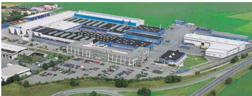
SOMMER – Stammwerk in Döhlau bei Hof/Saale, im Zentrum Europas

Haydnweg 1 D-88410 Bad Wurzach Tel. +49 (0) 75 64/93 52 57 Fax +49 (0) 75 64/93 55 54 wurzach@sommer-hof.de